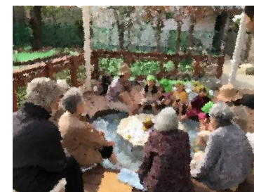
オリープナナ入居者の方と足湯で交流

今年度より園庭開放を始めるが、地域の方への宣伝力が足りず、参加者はなく、地域の方とのつながりを広げるには至らなかった。地域の方をお誘いできたのは、ベビーマッサージと『ナナのこどもの日』のみであり、次年度は、宣伝力を高めて取り組み、地域貢献に努めたい。