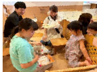
⇒ 『ナナのこどもの日』にて応急処置実践