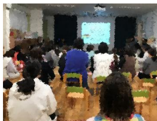
防災連携園での合同研修