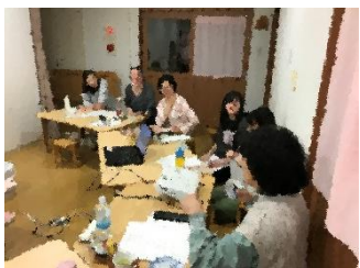
3園合同外部講師の食事研修

今年は、体験的な研修（手仕事・読書会・唄の集い等）を取り入れ、職員全員で実践することができた。人と集い、手を動かし、何かが出来上がっていくプロセスは成果物が見えるため、一緒にできた喜びや語り合う楽しさを実感できたように感じる。その中で、自然と会話も弾み、互いの存在を高め合う機会となっていった。また研修で得たことを日々の保育に活かすことで、学びがより深まり、実りあるものとなった。