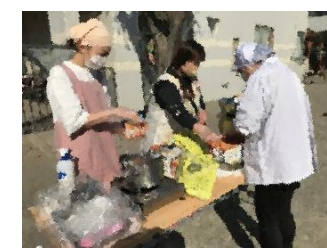
11月 防災連携園 炊き出し訓練