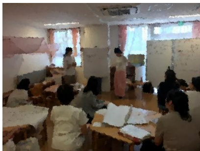
全体会議で各部署の目標を園全体で共有した