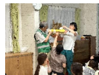
6月、10月 防災連携園合同研修