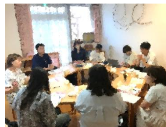
7月 幼保小連携担当による保育参観と協議