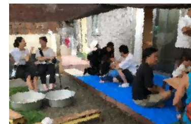
・『ナナのこどもの日』感覚器官の掲示と体験コーナー ・園庭での卒園児や保護者同士の交流